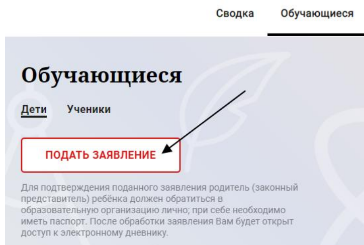
Рисунок 2 – Подача заявления на подключение к сервису

Далее требуется зайти в раздел «Обучающиеся» к странице формы подачи заявления на подключение (Рисунок 2).